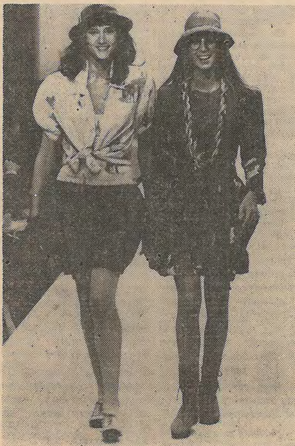
«Мини» возвращается. Во всяком случае такой вывод можно сделать, посмотрев эти модели (на снимке), предложенные итальянскими модельерами в коллекции одежды сезона весна-лето 1988 года.

Ждем в понедельник 30 ноября в 17.00 в 216 аудитории УЛК всех желающих принять участие в разговоре, который, надемся, поможет нам найти новые пути в перестройке студенческой многотиражной печати.